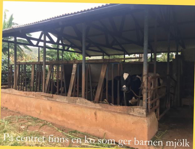
På centret finns en ko som ger barnen mjölk

Visste du att nästan alla barn som bor på barnhem har en familj. Men av olika anledningar kan/får de inte bo hos dem. Visst är det lite knasigt? Alla barn har rätt till en familj.