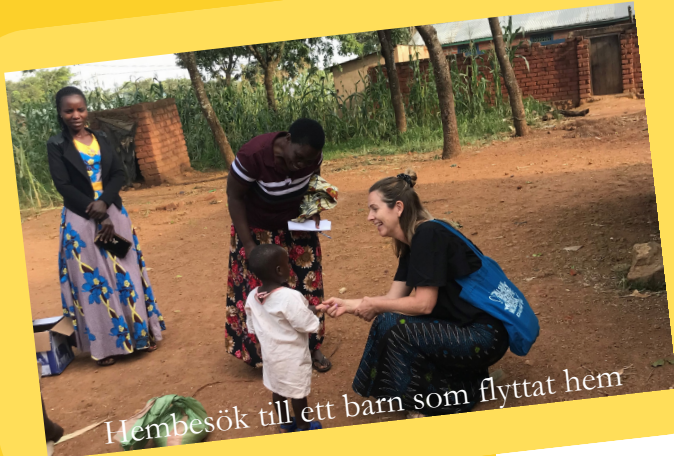
Hembesök till ett barn som flyttat hem

Till familjecentret i västra Tanzania (som barnhjälpen stöttar) får barn komma och bo en kort tid medan deras familj förbereder sig för att ta emot dem igen. För de flesta barnen har deras mamma dött och då är det svårt för familjen att klara av att ta hand om en bebis. Men när de är redo kommer det lilla barnet hem. Ibland får barnen flytta till en annan släkting, som sin farbror eller sin mormor. En familj kan ju se ut på många olika sätt.